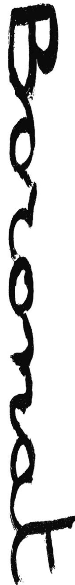
Oli sobre tela, 81 x 59 cm.