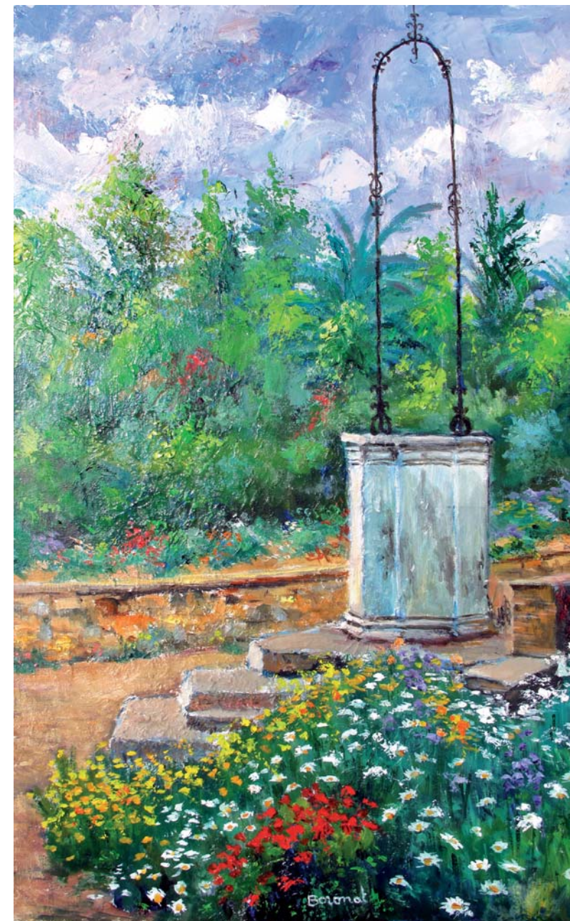
El pou de l'amor, Jardí Botànic, Blanes. Oli sobre tela, 61 x 38 cm.