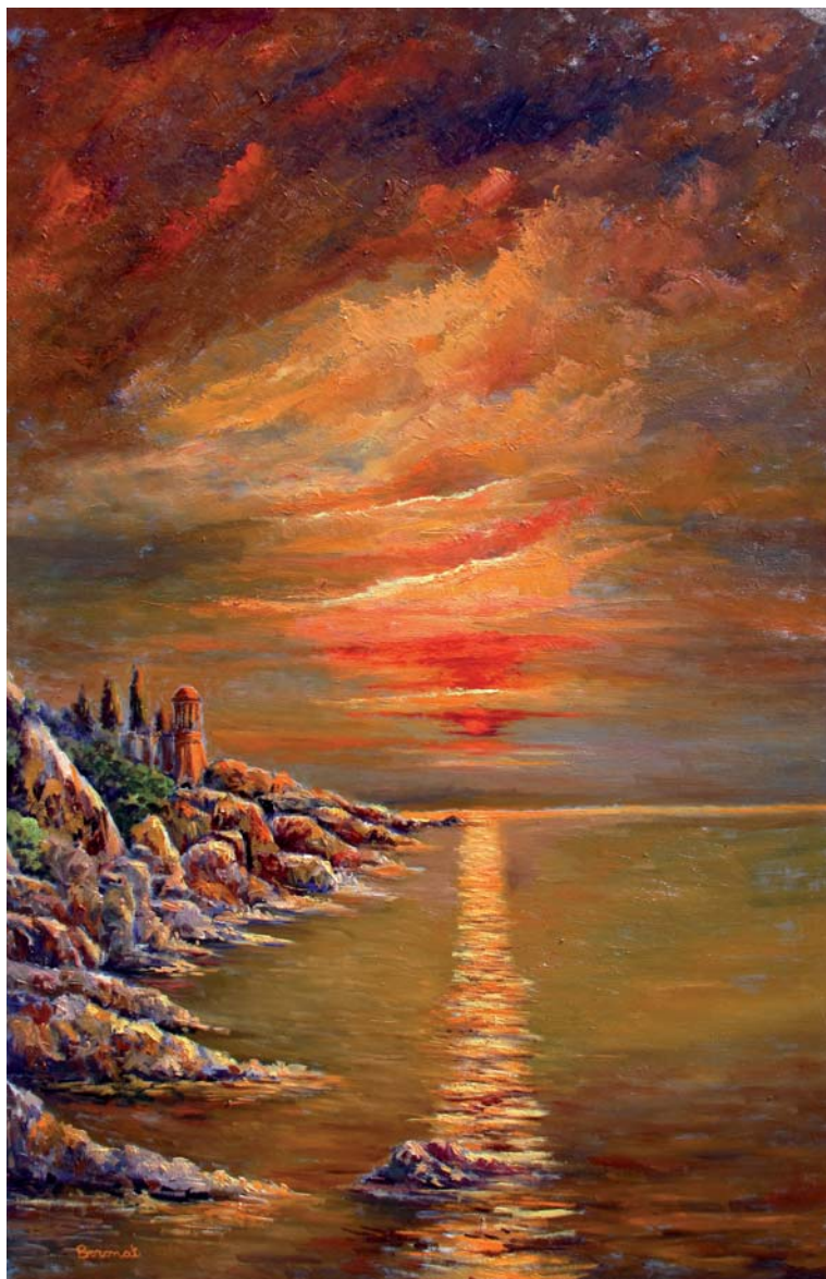
Sortida de sol a la cala Forcanera, Blanes. Oli sobre tela, 130 x 80 cm.