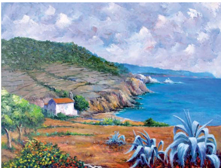
L'Ermite de Sant Francesc (abans), Blanes. Oli sobre tela, 81 x 65 cm.