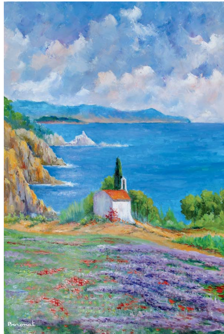
L'Ermita de Sant Francesc, Blanes. Oli sobre tela, 81 x 65 cm.