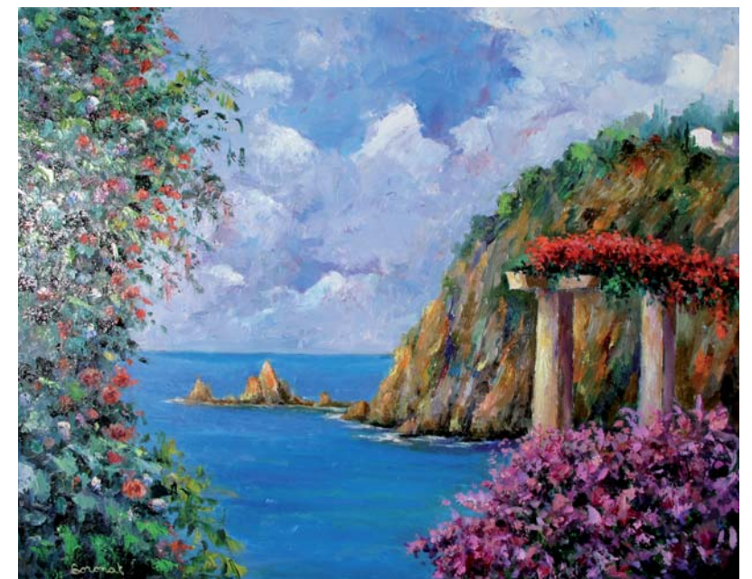
Racó del Jardí Botànic, Blanes.