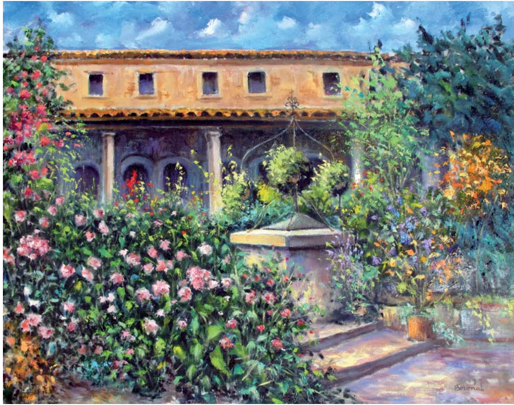
Racó del claustre del convent de Blanes.